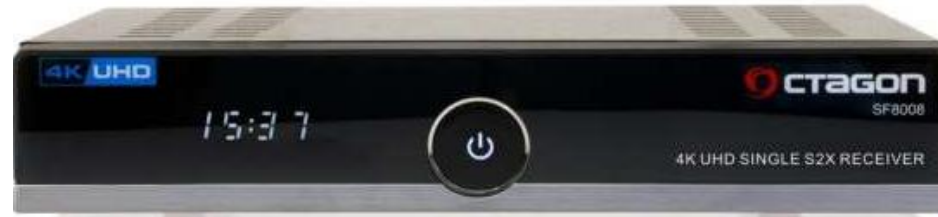
OCTAGON SF8008 4K UHD 2160p H.265 HEVC E2 Linux DVB-S2X Single Sat Receiver